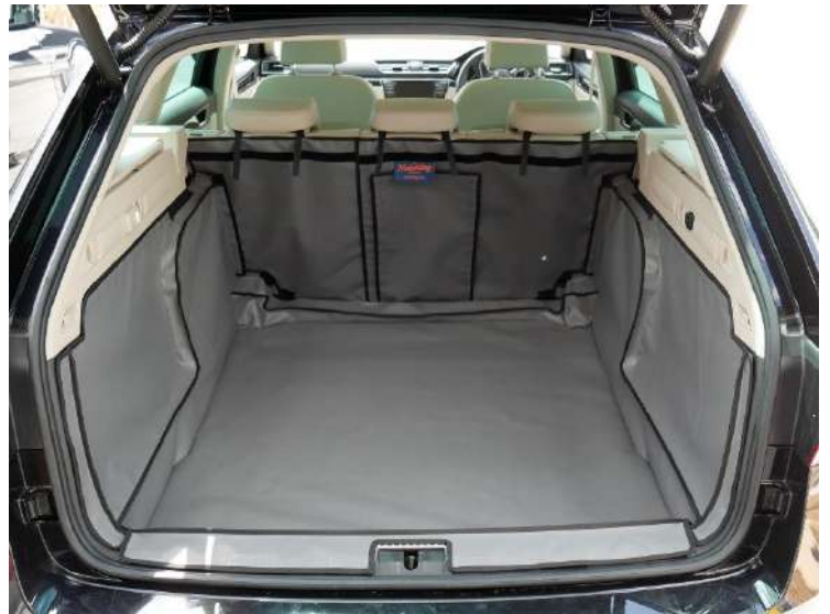
Variabele vloer verwijderd