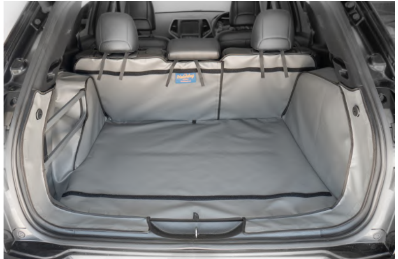
Achter Plus met gesplitste stoelen voorbereid voor Stoel Flap en Bumperflap