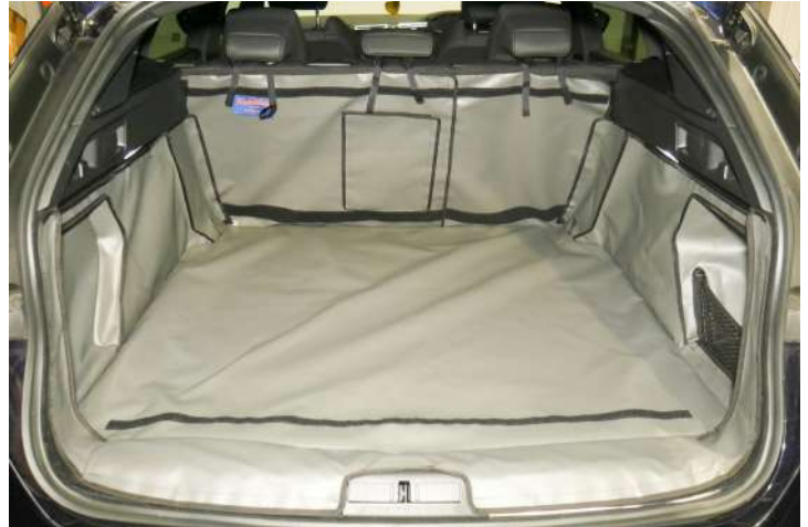
SH1: Gesplitste kofferbakbescherming, voorbereid voor stoel flap, bumper flap & bodemverlenging