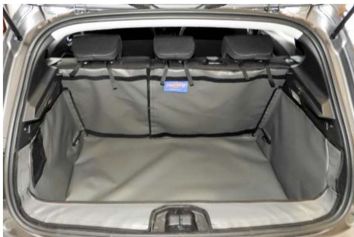
Gesplitste kofferbakbescherming, voorbereid voor stoel flap, bumper flap & bodemverlenging